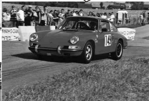
Porsche 911 2,0 de 1965 de Pierre MONNAY slalom du Mandement