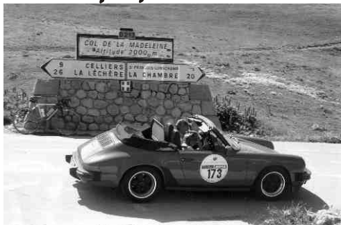
Porsche 911 Carrera de 1985 Chaponnier / Chaponnier Coupe des Alpes