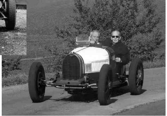
Bugatti 35 B de 1930 Hans Matti / M. Crowley-Milling Rétrospective Michaelskreuz